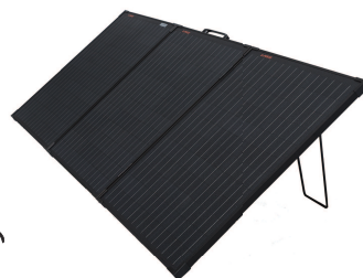
折り畳み式太陽光パネル EJSTSP150

EJ-POWER 蓄電池に充電できる太陽光パネル 【300W で充電時間約 5 時間】 ※日照条件により変わります。 最大出力 /150W 最大電流 /8.33A 解放電圧 /21.24V 短絡電流 /9.17A サイズ /622×1543×20mm 折り畳み時サイズ /622×513×60mm 重さ /6.5kg 携帯用バッグ、延長ケーブル 3m×4 本